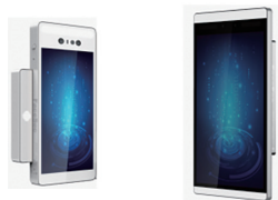
5.5インチ (シルバー/ゴールド ローズゴールド ライトグレー/ティープグレー)