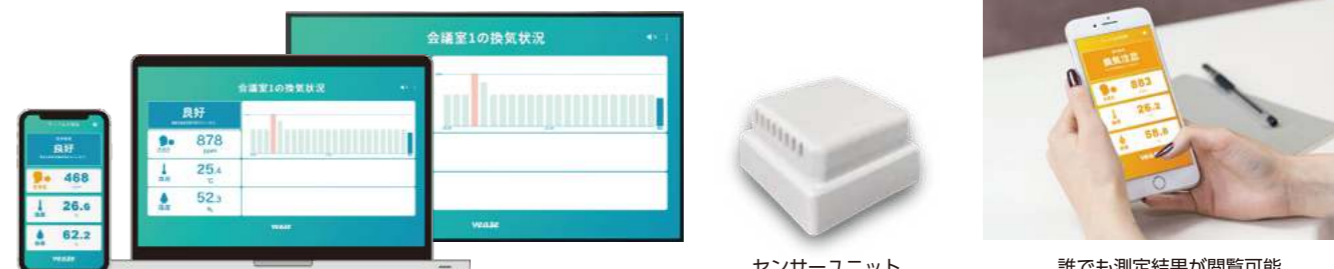
センサーユニット