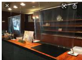
707、ビュッフェ、客席等のパーテーション